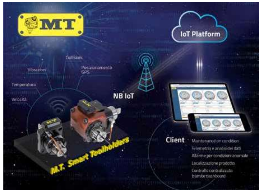
A sinistra: Smart Toolholder assiale

Grazie al progetto Smart Toolholder MT rende disponibili tutti gli strumenti per realizzare la Maintenance on Condition (manutenzione basata sulla condizione). Il sistema infatti analizza le tempistiche e le condizioni effettive di lavoro del portautensile rotante, permettendo una manu-