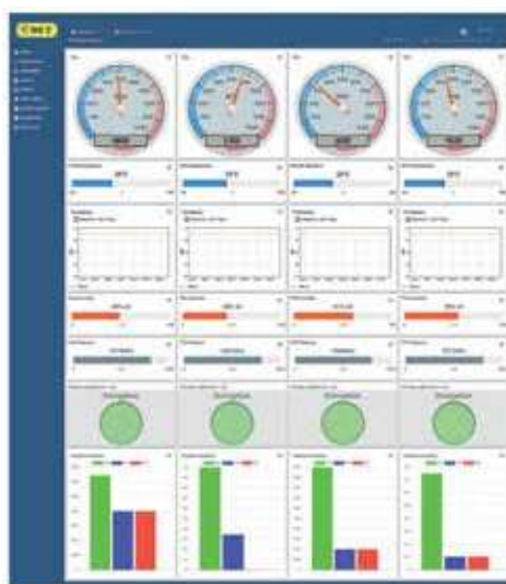
Pannello di controllo per l'analisi dei dati raccolti

mente a due componenti strategiche del marketing nel settore manifatturiero dei prossimi anni: la Servitization, cioè il passaggio dal concetto di "prodotto" a quello di "servizio" e, nell'accezione più completa, la fornitura al cliente del "prodotto + servizio". Grazie alle soluzioni di telemetria, Analytics Big Data, control room, app dedicate e al servizio di Maintenance on condition, la soluzione sviluppata da MT permette di effettuare un ulteriore passo avanti, fornendo al cliente il pacchetto "prodotto + servizio + valore aggiunto", dove il valore aggiunto è dato dalla riduzione dei costi, dal risparmio sulla rottura e dall'incremento della qualità dell'utensile. È ovvio che per potere conoscere l'effettivo utilizzo del sistema, sia esso un'auto o un portautensile motorizzato, è necessario disporre di un sistema che trasmetta i dati del proprio utilizzo: in altri termini, un