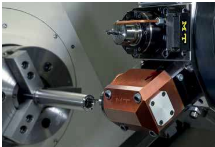
Smart Toolholder assiale in lavorazione

Lo sviluppo di questa soluzione pone MT nelle condizioni di rispondere pronta-